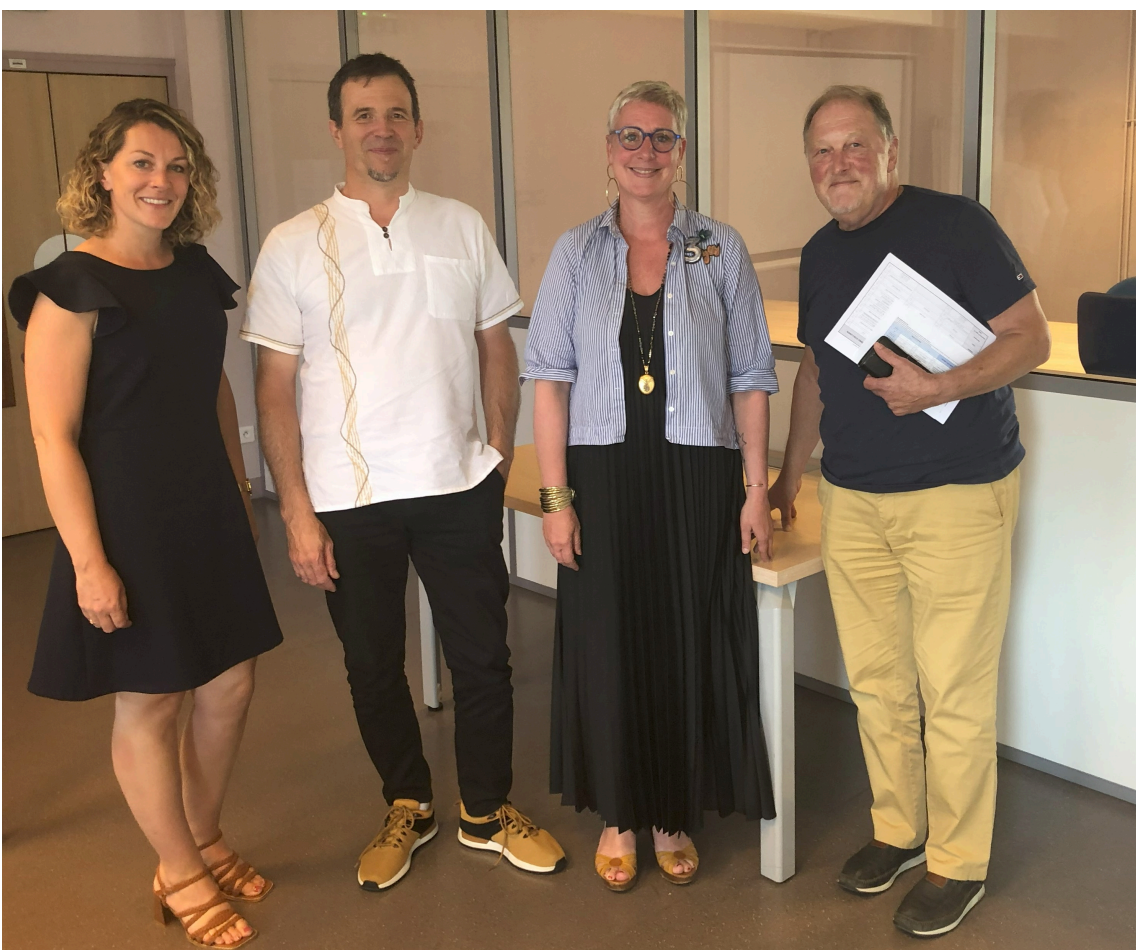
Rencontre du 18 juillet