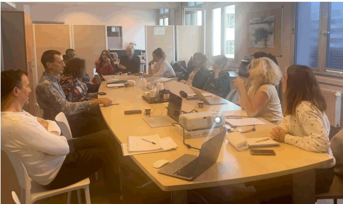
Réunion du 12 septembre